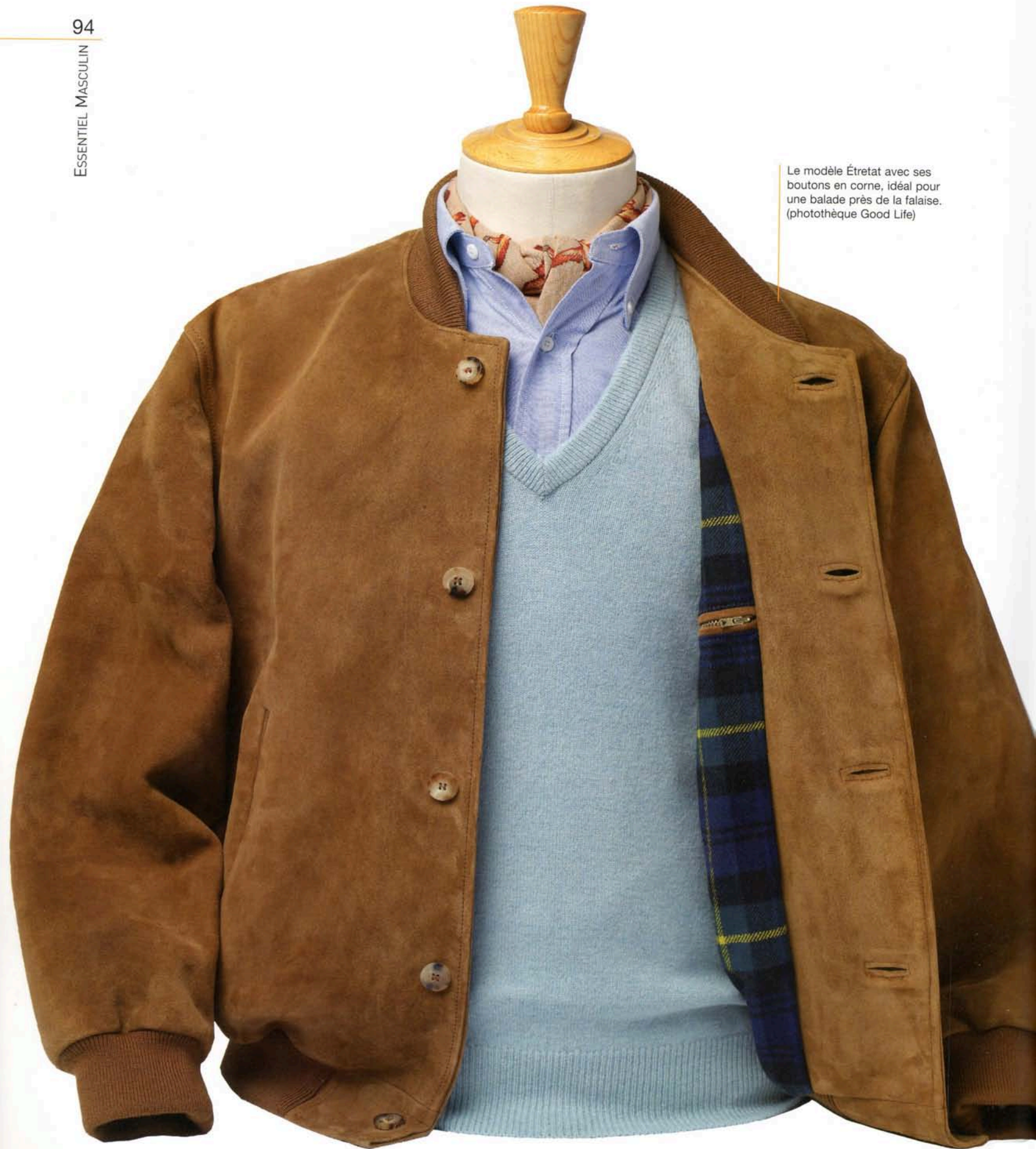
Le modèle Étretat avec ses boutons en corne, idéal pour une balade près de la falaise.